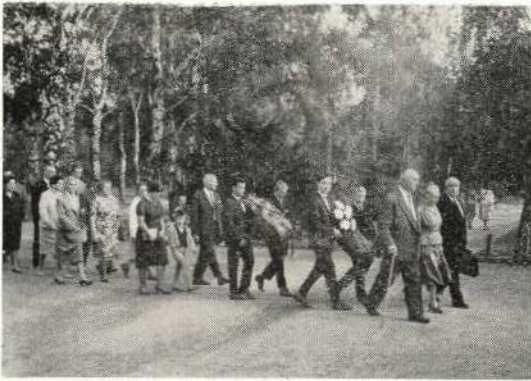
Auf dem Wege zur Gedächtnisfeier